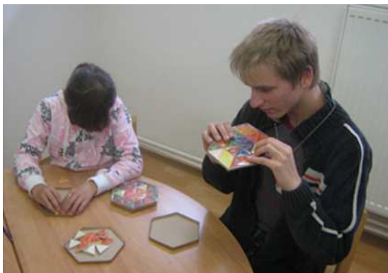
SPC centrum– Hradec Králové, 2009