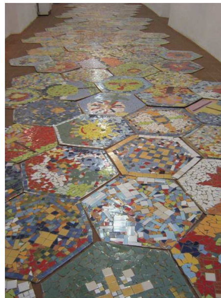
Výstava v Galerii „Konírna“ Beroun, 2007