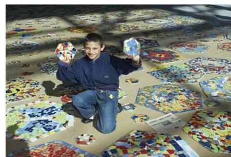
Letiště Praha, 2007