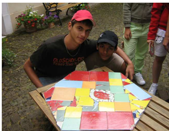
Dětský domov „Sazená“ – Mělník, 2008