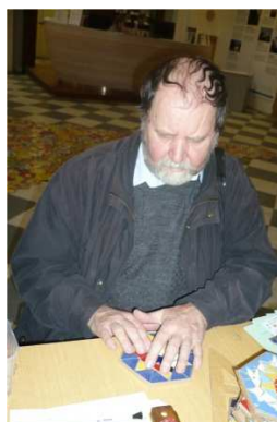
Barvy slov, 2009