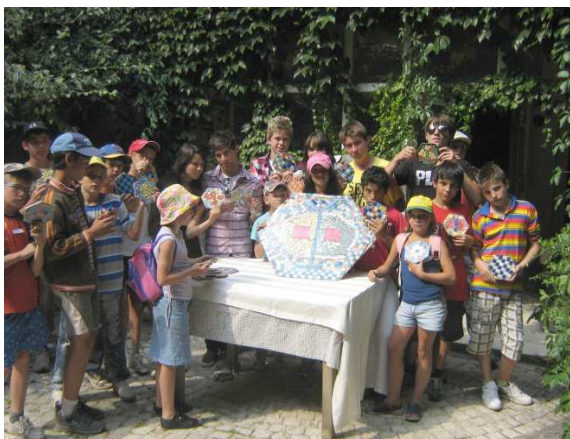
„Domov srdce“– 2009