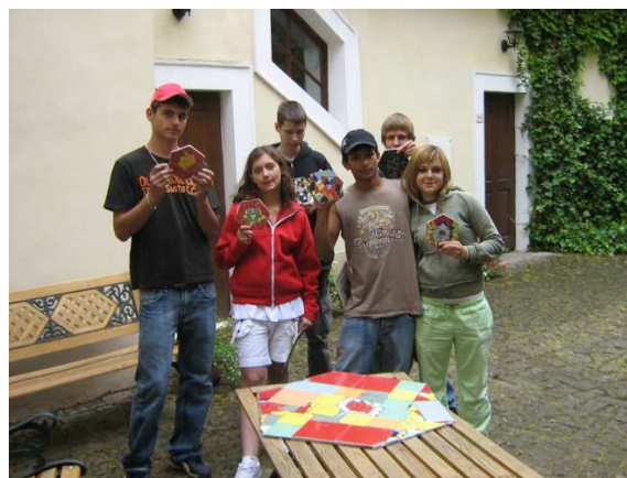
Dětský domov „Sazená“ – Mělník, 2008