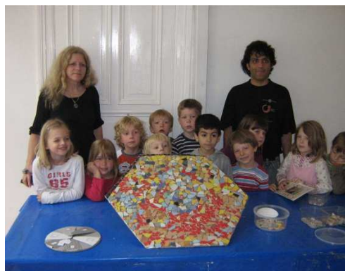
Flohzirkus . Hamburk, 2007