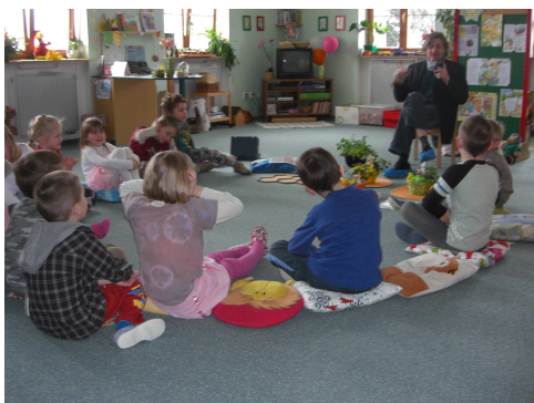
Mš V Zahradě, Liberec 2010