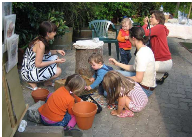
Botanická zahrada Univerzity Hamburk, 2007