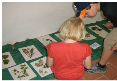
Regionální muzeum Mělník, 2008