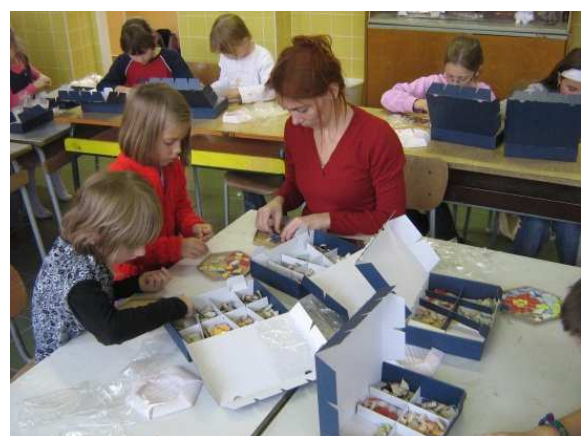
Spolupráce se školou – Lochkov, 2009