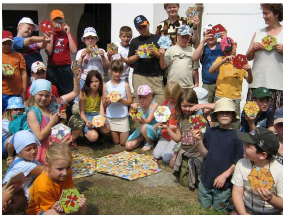
Muzeum Českého krasu Beroun, 2007