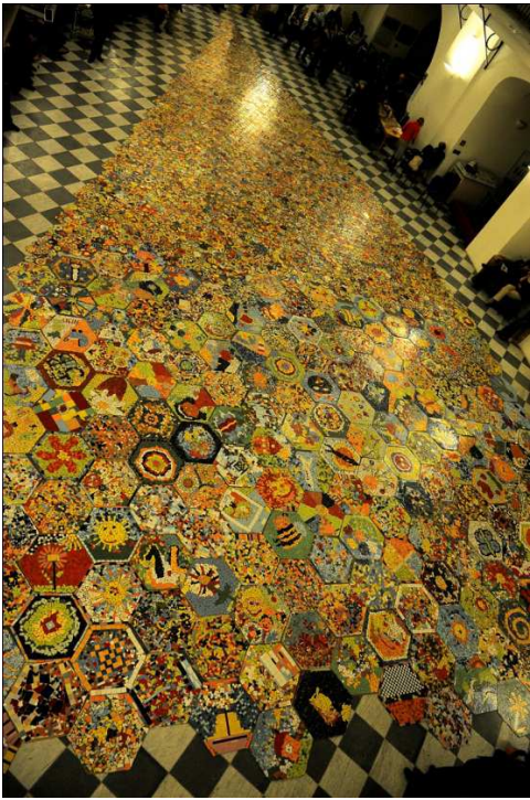
Výstava v Českém muzeu hudby, 2009