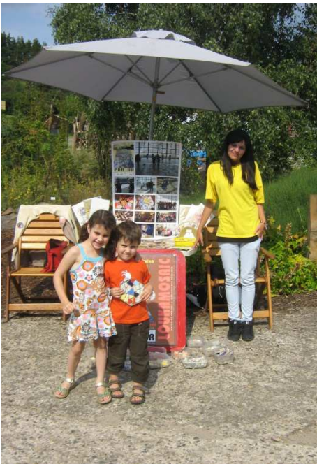
Botanická zahrada Troja, 2008