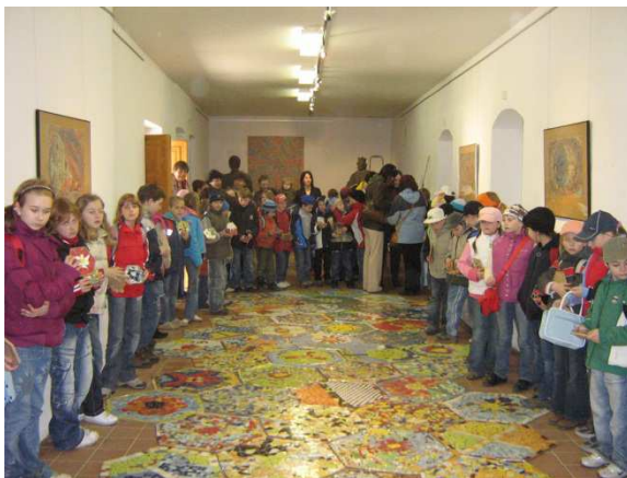
Vernisáž – Beroun, 2007