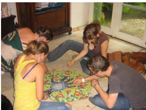
Studenti „Ecole Bellecour Arts Appliqués“ z Lyonu v Atelieru Femancipation , 2009