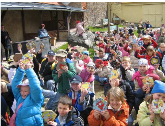
Pochod květů – Beroun, 2007