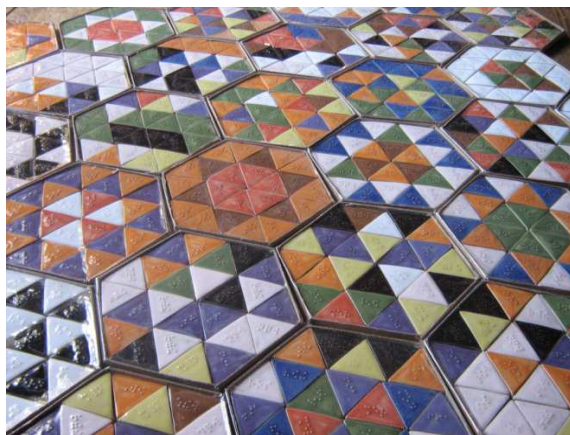
Mozaičky vytvořené nevidomými