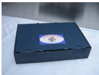
25,5 cm x 18 cm x 5 cm