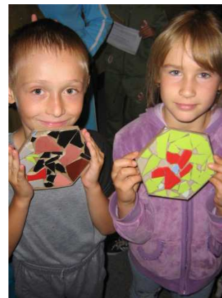
„Bauspielplatz“ a „Flohziirkus“ Hamburg, 2007 a 2008